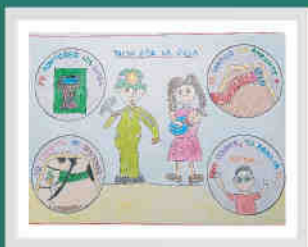
Niño - 6 años Tambomayo - Buenaventura

"SI NOS CUIDAMOS JUNTOS, NOS CUIDAMOS MEJOR"