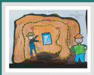
Niño - 4 años Tambomayo - Buenaventura

GANADORES DEL CONCURSO DE DIBUJO "UN CUENTO DEL PACTO POR LA VIDA"